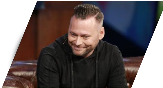
DZIENNIKARZ BUDZĄCY EMOCJE