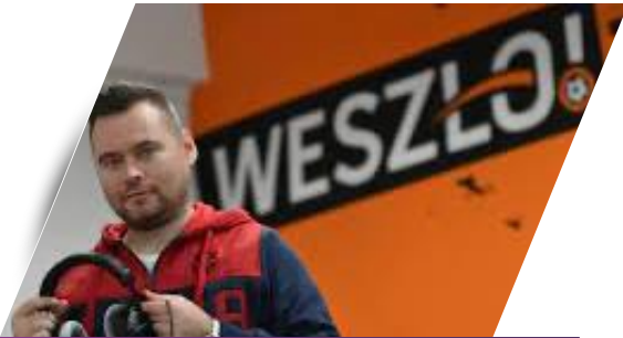
TWÓRCA I WŁAŚCICIEL GRUPY WESZŁO